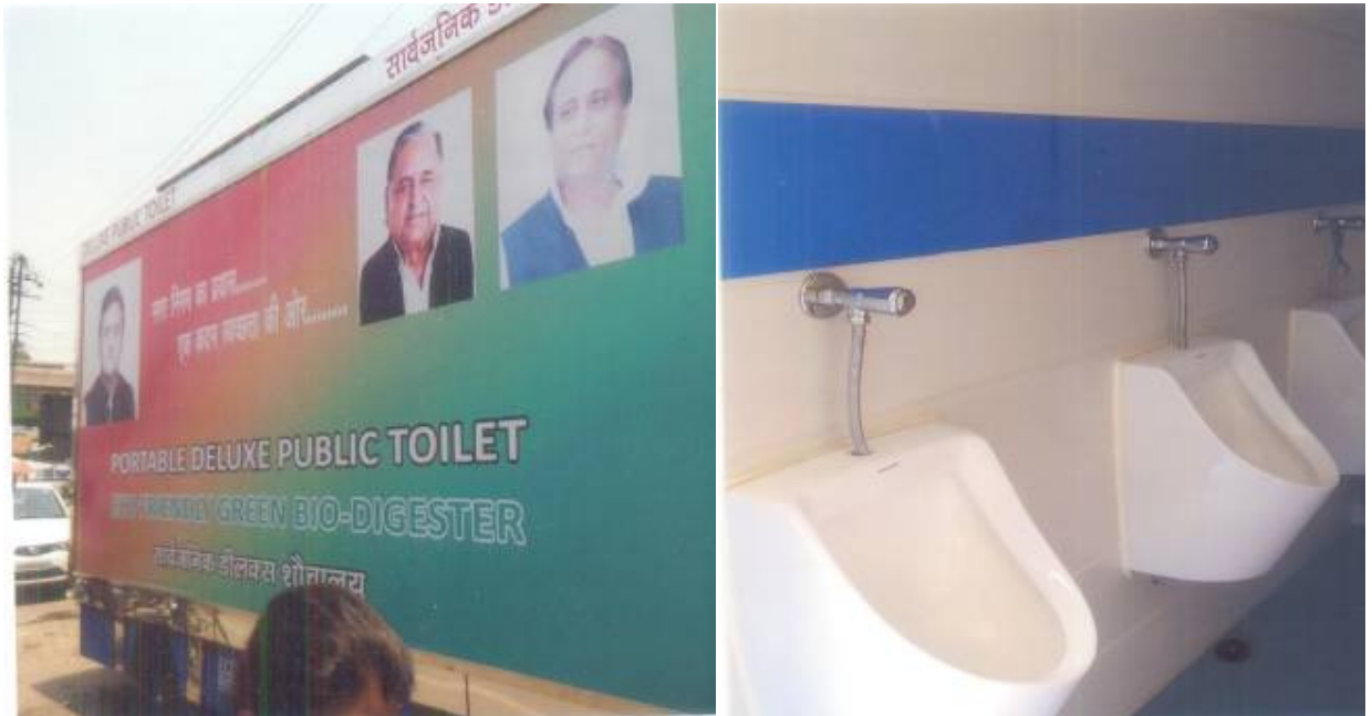
भगवान टॉकीज पर स्थापित सार्वजनिक शौचालय

नालों को गन्दगी से भरते हुए रोकने के लिए नगर निगम द्वारा चमड़े की कतरन को क्रय कर एकत्रित कर उचित निस्तारण हेतु भेजा जाता है।