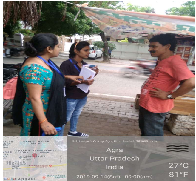
G-8, Lawyer's Colony, Agra, Uttar Pradesh 282005, India

Agra Uttar Pradesh India 27°C 81°F 2019-09-14(Sat) 09:12(am)