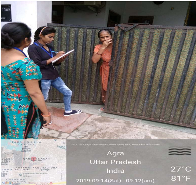
35-A, Gollaj Bagaj, Ganesh Nagar, Lawyer's Colony, Agra, Uttar Pradesh 282005, India

Agra Uttar Pradesh India 30°C 86°F 2019-09-03(Tue) 09:14(AM)