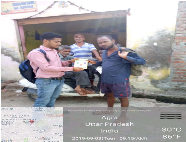
Unnamed Road, Guler Ka Nagla, Shaligram, Agra, Uttar Pradesh 282010, India

Agra Uttar Pradesh India 33°C 91°F 2019-09-03(Tue) 10:39(am)