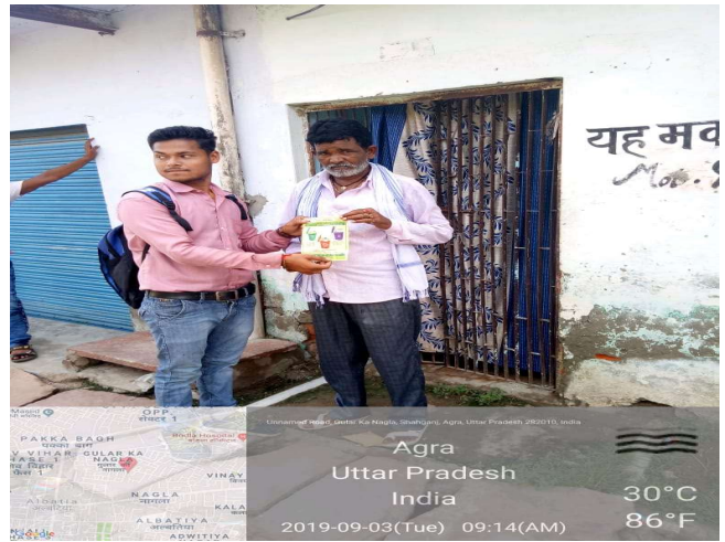
Unnamed Road, Guler Ka Nagla, Shaligram, Agra, Uttar Pradesh 282010, India

Agra Uttar Pradesh India 30°C 86°F 2019-09-03(Tue) 09:15(AM)