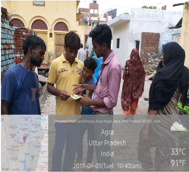
Unnamed Road, Saraikhwaja, Arjun Nagar, Agra, Uttar Pradesh 282001, India

Agra Uttar Pradesh India 33°C 91°F 2019-09-03(Tue) 10:40(am)