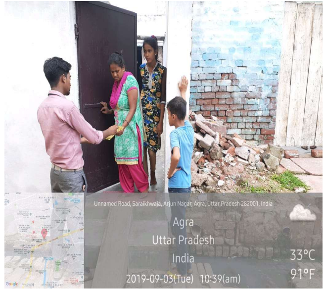
Unnamed Road, Saraikhwaja, Arjun Nagar, Agra, Uttar Pradesh 282001, India

Agra Uttar Pradesh India 33°C 91°F 2019-09-03(Tue) 10:40(am)